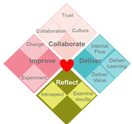
The Heart of Agile by Alistair Cockburn

Das Trigon-Systemmodell hilft dabei, Stärken und Schwächen der einzelnen Systemelemente und der Verbindung zu erkennen und Prioritäten zu setzen.